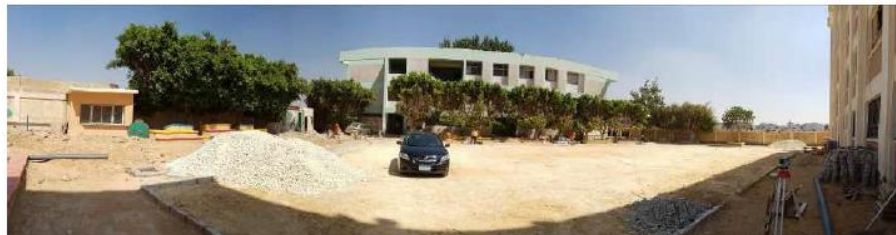
رسم توضيحي ٦: ملعب مدرسة صلاح الدين أثناء التطوير