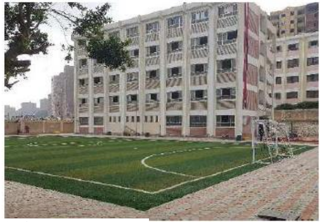
رسم توضيحي: ملعب مدرسة صلاح الدين بعد التطوير