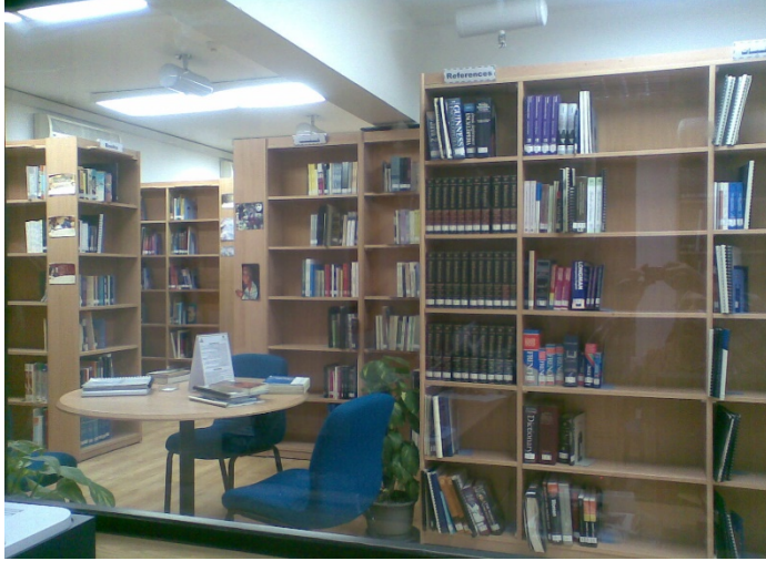
صورة توضح مكتبة المجلس عام 2001